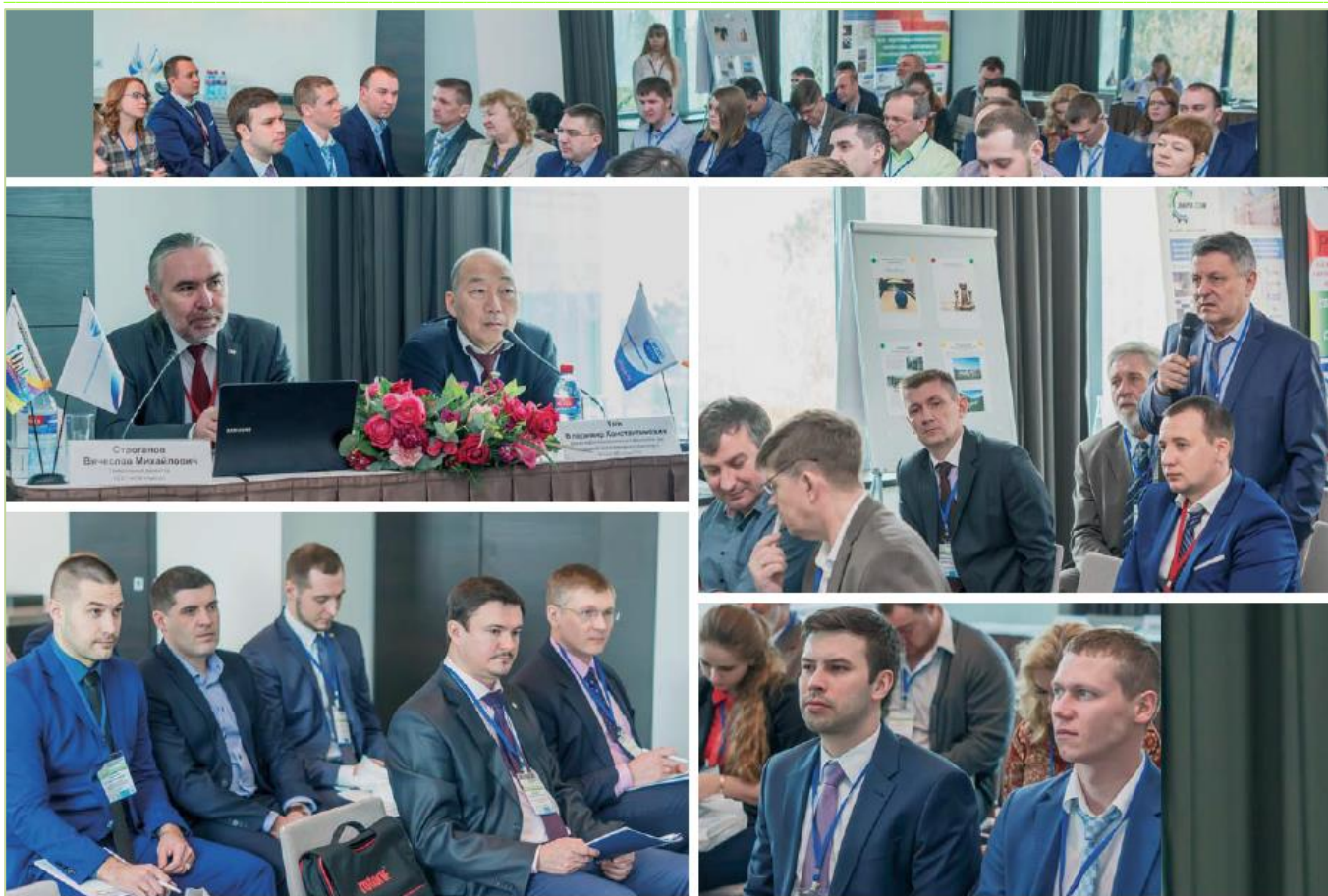
6-я Международная научно-практическая конференция «Сбор, подготовка и транспортировка нефти и газа. Проектирование, строительство, эксплуатация – 2017», 20–25 марта, г. Сочи

предлагаемых технологий и разработок, извлечь максимальную пользу от встреч. Век скоростей и глобальных проектов приводит к истощению сил, потере активности и внимания. Эксперты в области бизнес-коммуникаций отмечают важность выбора места проведения массовых деловых встреч и умения сочетать интенсивные переговоры с общением в непринужденной обстановке. Цель деловых переговоров – эффективное решение определенных задач, поэтому обстановка встречи должна быть максимально комфортной, располагающей, настраивающей на плодотворный, конструктивный лад. Конференция по сбору, подготовке и транспортировке углеводородов, проходящая в уютном курортном городе Сочи, полностью отвечает требованиям создания оптимальных условий для успешного делового общения, практически идеально соблюдая баланс между тематически насыщенными рабочими сессиями и встречами свободного формата.